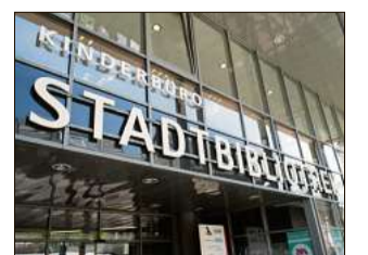
Die Bibliothek hat in den Ferien geöffnet.

Nagold. Die derzeitigen reduzierten Öffnungszeiten der Stadtbibliothek Nagold sind: Dienstag: 10 bis 18 Uhr, Donnerstag und Freitag: 13 bis 18 Uhr sowie Samstag 10 bis 14 Uhr. In den Sommerferien hat die Stadtbibliothek Nagold zu den bekannten Öffnungszeiten normal geöffnet. Eine Ausnahme bilden nur folgende Termine: Dienstag 18. August und 25. August. An diesen beiden Dienstagen hat die Stadtbibliothek lediglich von 10 bis 14 Uhr geöffnet.